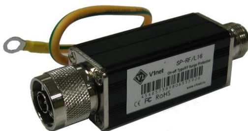
Рис.1 Внешний вид SP-RF/L16