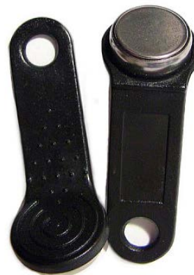
Внешний вид с креплением