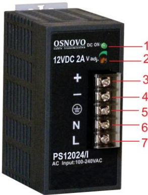
Рис. 2 Блоки питания PS-12024/I, PS-55048/I.