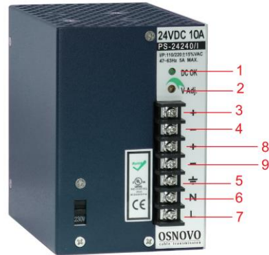
Рис. 3 Блоки питания PS-12120/I, PS-12150/I, PS-12240/I, PS-24048/I, PS-24120/I, PS-24150/I, PS-24240/I, PS-24360/I, PS-55150/I, PS-55240/I, PS-55360/I