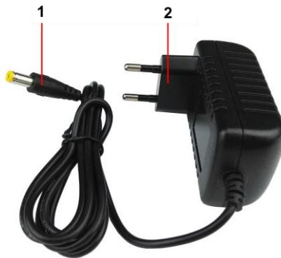
Рис. 1 Блок питания PS-48024, внешний вид, разъемы