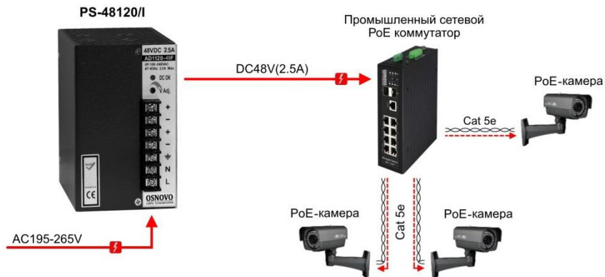
Рис.4 Типовая схема подключения блоков питания на примере PS-48120/I