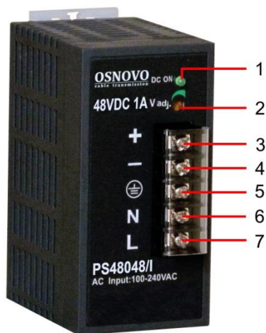
Рис.1 Блок питания PS-48048/I внешний вид, разъемы и индикаторы